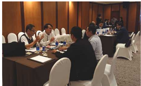
ベトナム現地商談会(2019年)

台湾は、約2300万人の人口に加え、国際通貨基金(IMF)が2018年4月に公表した「世界で最も裕福な国」ランキングで19位となっており、アジアの中でも裕福な地域です。