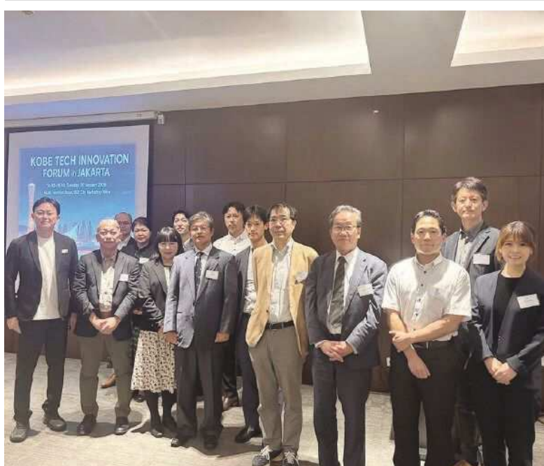
商談会には神戸市の企業6社が参加した