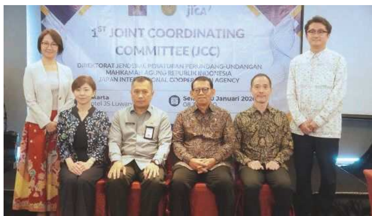
初会合に参加したJICAインドネシア事務所所長（左から2人目）と、インドネシア法務省及び最高裁判所の幹部ら

国際協力機構（JICA）は20日、日本の法務省の協力を得て、インドネシア法務省と最高裁判所が実施している「ビジネス環境改善のための法・司法改革プロジェクト」に関する初会合を開催した。経済分野における法制度の整備は投資環境改善の中核要素であり、インドネシアが目指す経済協力開発機構（OECD）加盟に向けて重要な要件の一つと強調。今回の協業を通じて「同じ釜の飯を食う仲間」と言えるような絆をお互い育めるようにしたい」と期待を示した。